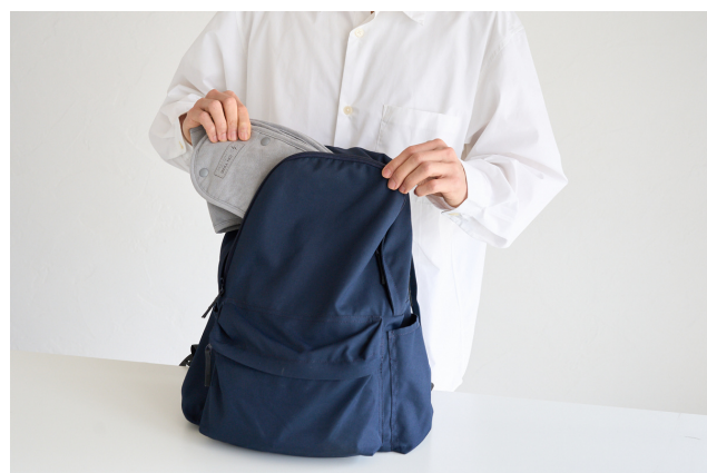
④ コンパクトにバックへ収納できます。