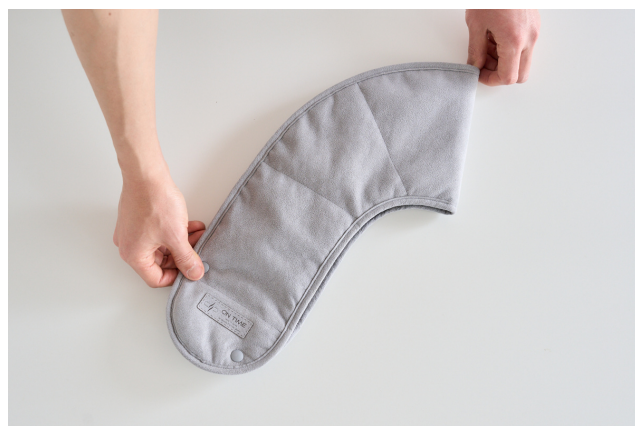
② 真ん中で折りたたみます。