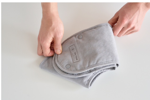
③ さらに折りたたみます。