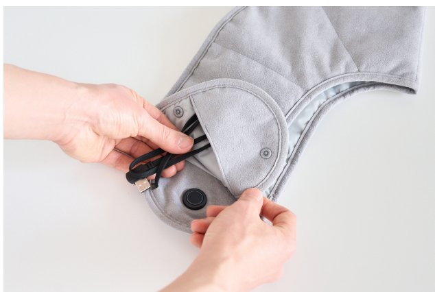
① コードを丸めてポケットにしまえます。